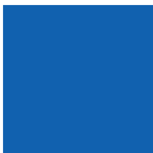
Couleur unique (PRINT)