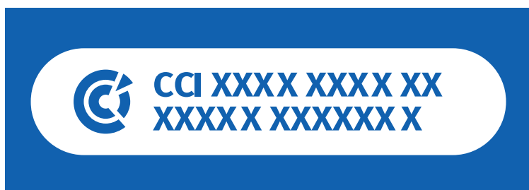
Exemple de version CMJN sur fond de couleur