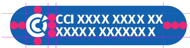
Version CMJN sur 2 lignes

Suivant l'appelation de la CCI, il est possible de composer sur une ligne ou deux lignes :